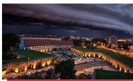
Bastionul Maria Theresia (1.5km)